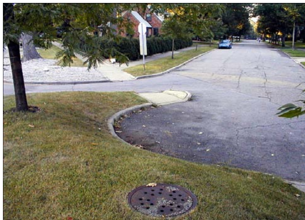
Figure 2 Une fermeture partielle de rue

des stratégies d'intervention participant de ce qui est désigné comme l'approche par « points noirs » — ou approche ciblée. Les auteurs mobilisant cette conception de l'apaisement identifient l'une ou l'autre de deux origines différentes. La majorité des auteurs, soit ceux qui mettent l'accent sur la vitesse uniquement et qui sont généralement européens, situent son origine au début des années 1970, dans la ville de Delft, aux Pays-Bas. C'est en effet dans ces années qu'une équipe de techniciens de cette municipalité a construit le premier dos d'âne allongé à l'extrémité d'une allée afin d'y réduire la vitesse de circulation (Schlabach, 1997). Les auteurs, moins nombreux, qui incluent parmi les mesures d'apaisement certaines interventions visant à agir sur les volumes de circulation d'une rue donnée sont en général nord-américains et ils situent alors l'origine de l'apaisement de la circulation à la fin des années 1940 ou au début des années 1950. C'est à ce moment que les villes états-uniennes de Montclair, au New Jersey, et de Grand Rapids, au Michigan, ont transformé des rues existantes en impasses et mis en place des îlots de canalisation pour éliminer la circulation de transit sur quelques rues (Ewing, 1999).