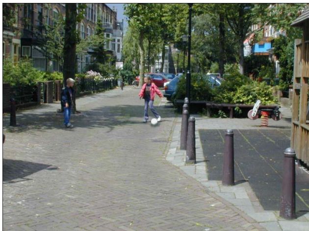
Figure 3 Un woonerf néerlandais

chapitre depuis quelques années. Londres a, et ce depuis la fin des années 1990, développé 399 interventions sectorielles sur son territoire. Lyon a, quant à elle, désigné, au milieu des années 2000, une zone incluant 87 km de rues comme cible d'une intervention sectorielle — il s'agit de la plus grande zone du continent européen —, et les mesures y sont toujours en cours d'installation.