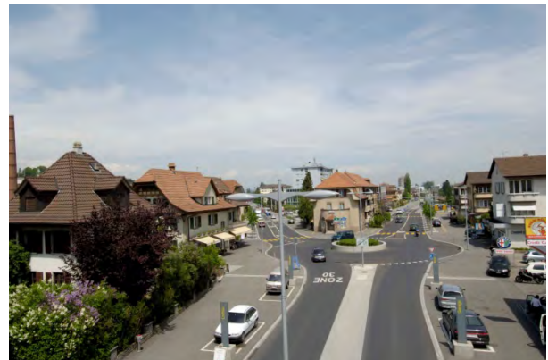
Figure 2 L'intervention de traversée d'agglomération : une voie publique pour tous

Les interventions prennent des formes variables en fonction des objectifs et des buts et des « zones contextuelles » des traversées d'agglomération. En effet, les aménagements spécifiques ne seront pas les mêmes selon que l'on considère les entrées-sorties ou les cœurs urbains, ou encore si l'on souhaite que les vitesses pratiquées soient de 60 km/h ou de 30 km/h dans le cœur urbain. La détermination de ces découpages et paramètres se fera selon l'importance relative qui sera accordée à la fonction de transit par rapport aux autres usages des voies publiques ou de ses rives.