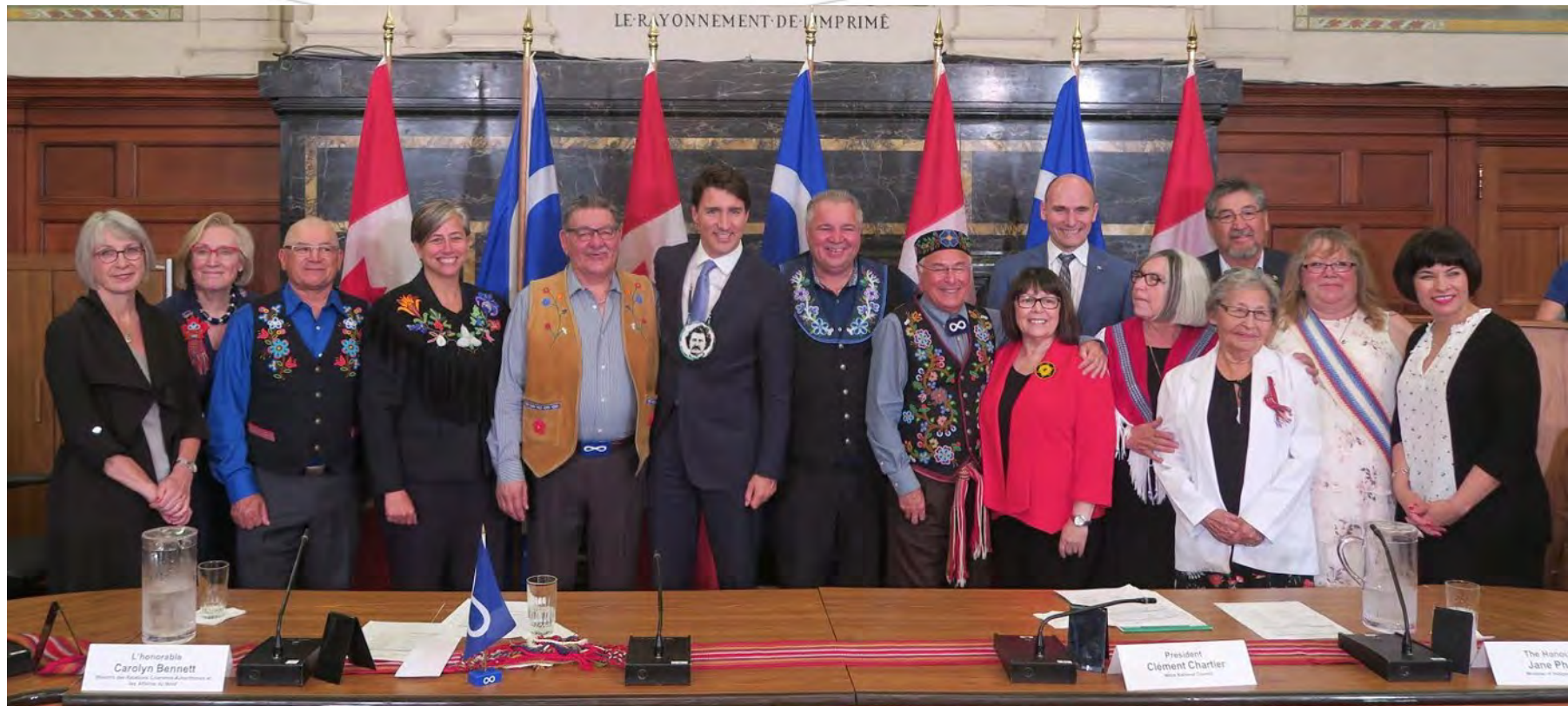
Sommet Couronne – nation des Métis, le 15 juin 2018.