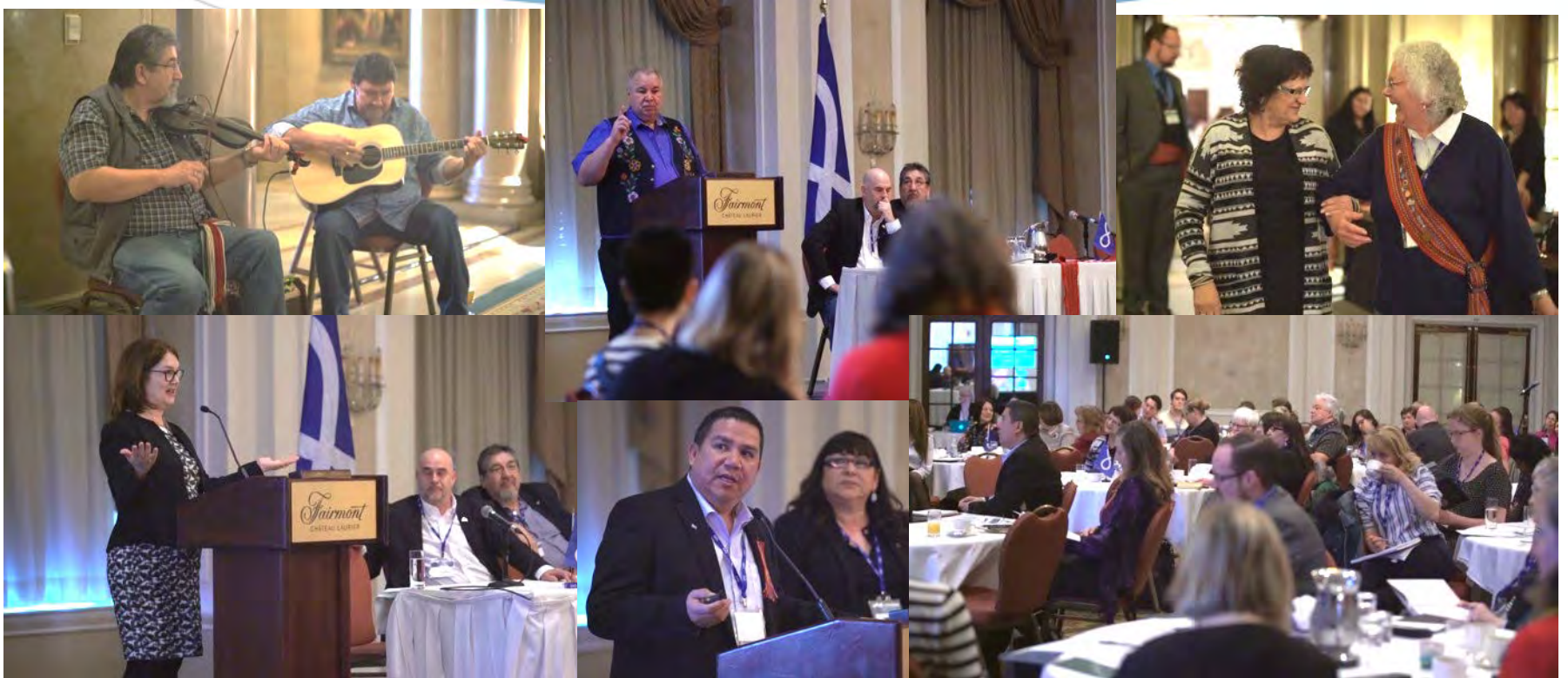
Forum sur la santé de la nation métisse, 26 et 27 février 2018, Ottawa, Ontario.