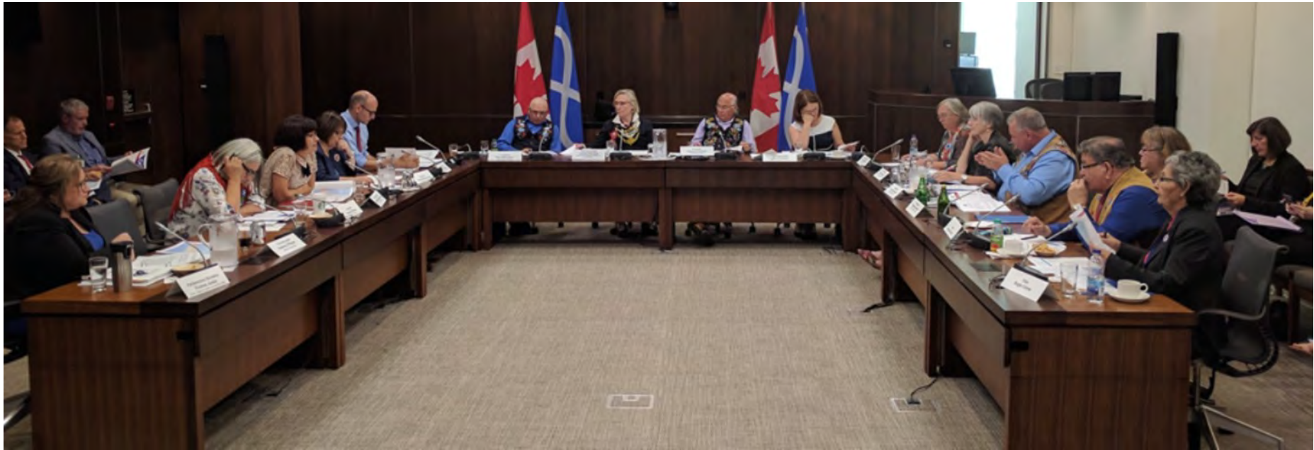
Rencontre entre les leaders de la nation des Métis et le cabinet fédéral. Ottawa, le 21 septembre 2017.