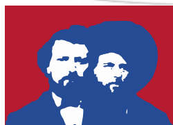
MÉTIS NATIONAL COUNCIL RALLIEMENT NATIONAL DES MÉTIS