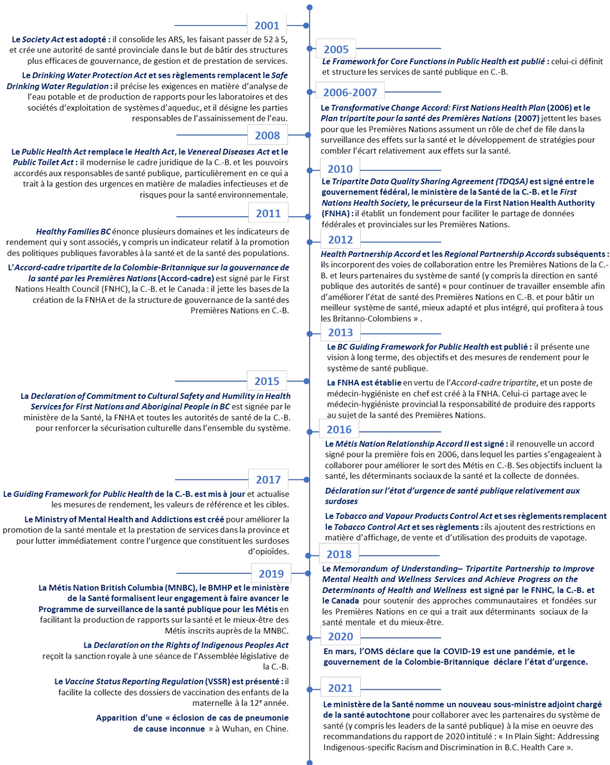
Figure 1 Chronologie des réformes récentes ayant une incidence sur le système de santé publique de la Colombie-Britannique

Sources: British Columbia Ministry of Health, s. d.-n, 2013; First Nations Health Authority, s. d.-b; First Nations Health Authority et Goss Gilroy Inc., 2020; First Nations Health Council, 2012; Vaccination Status Reporting Regulation, 2019; Health Council of Canada, 2014; Ministre de la Santé [Canada] et Minister of Health [Colombie-Britannique], 2011; Ministry of Mental Health and Addictions, 2021; Murphy, 2007; CCNPPS, 2018; Organisation mondiale de la Santé, 2020a, 2020b.